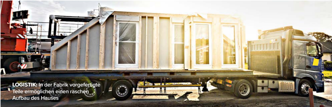
LOGISTIK: In der Fabrik vorgefertigte Teile ermöglichen einen raschen Aufbau des Hauses